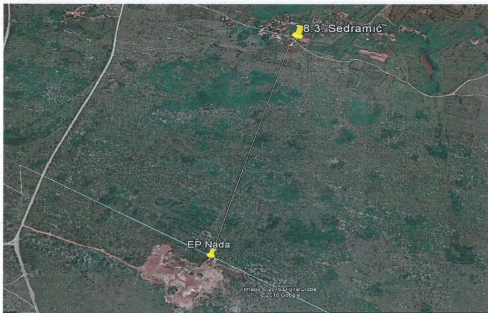
Slika 1. Mikrolokacija mjerne postaje Sedramić u odnosu na EP Nada